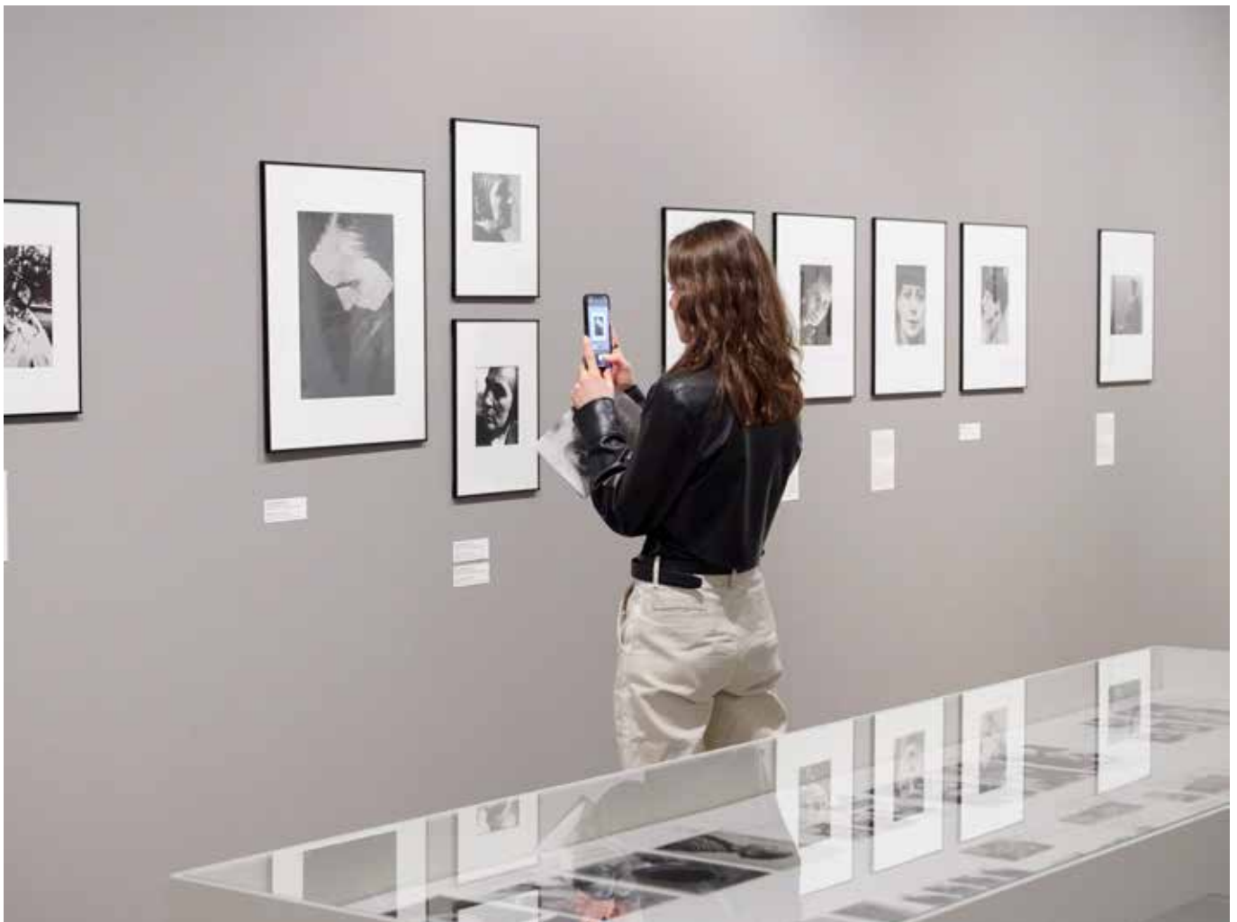
Besucherin in der Ausstellung, Lucia Moholy – Exposures, Fotostiftung Schweiz